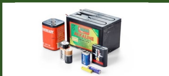
Piles alcalines, zinc-charbon et piles de clôture électrique