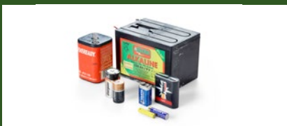
Piles alcalines, zinc-charbon et piles de clôture électrique