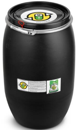
Fût de 120 litres contrôlé ONU