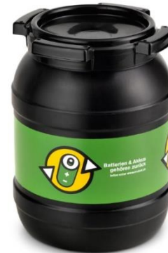
Petit fût de collecte