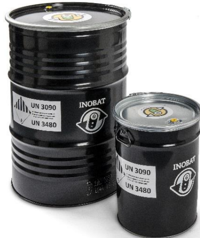
Fûts en acier contrôlés ONU 212 litres et 50 litres