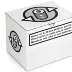
Boîte de restitution de pile pour petit fût de collecte, Battery-Box (carton) pour transport par la poste