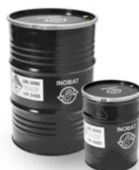
Fusti in acciaio approvati ONU da 50 litri e 212 litri per pile al litio e accumulatori agli ioni di litio, con inliner e materiale ignifugo vermiculite