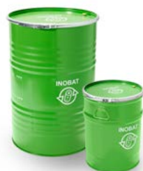
Fusti in acciaio approvati ONU da 50 litri e 212 litri per pile portatili