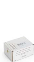
Scatola di rispedizione per il trasporto per posta

INOBAT mette a disposizione dei raccoglitori di pile per apparecchi tre tipi di contenitori e una scatola di rispedizione per i piccoli quantitativi che rispondono ai requisiti dell'ADR.