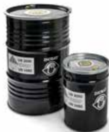
Fusti in acciaio con omologazione ONU per pile al litio, con inliner e materiale ignifugo / vermiculite (50 e 212 l)