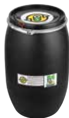
Contenitore per le merci pericolose con omologazione ONU per pile industriali e di apparecchi (120 l)