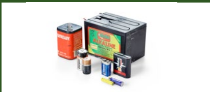
Alkaline-, Zink-Kohle- und Weidezaun-Batterien