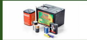
Alkaline-, Zink-Kohle- und Weidezaun-Batterien

Diese Gerätebatterien gehören ins grüne Stahlfass